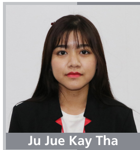
Ju Jue Kay Tha

As for me, the consistent learning opportunity of our insurance business and the supportive guidance of the management team can be identified our AYA SOMPO as more than an ideal workplace. Since day one at AYA SOMPO , I have never felt left-out in every aspect of my working life. I always feel that I am working with the professionals who I can learn from and will empower me to take on new and challenging opportunities. I have a dream that I will grow together with AYA SOMPO and I will try my best to make that dream comes true.